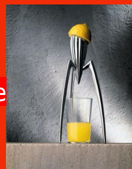
Presse agrume Alessi par Philippe Starck