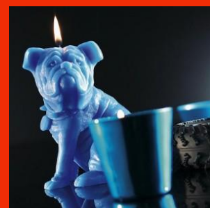
Chien Sam'Suffit chez Bougies La Française