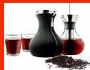
Théière Eva solo par The Tools